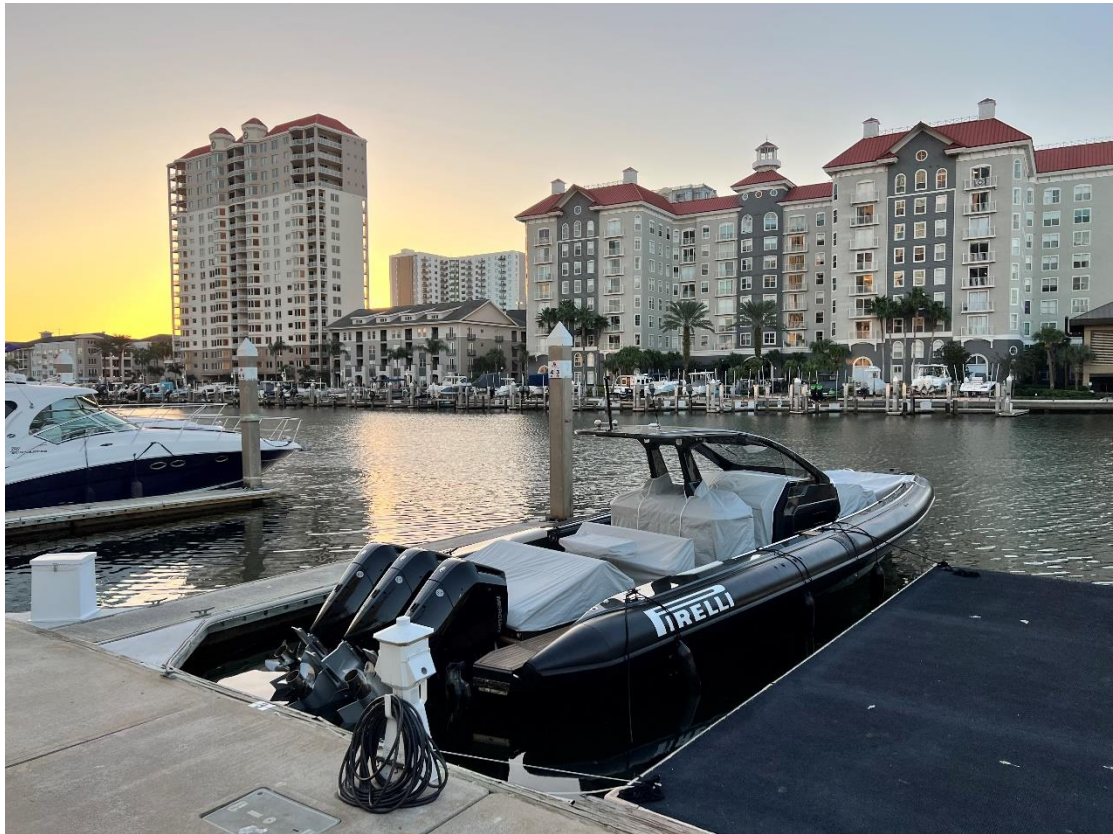
圖一、佛羅里達坦帕市的清晨。

以後不要再發錯音，叫錯名字了。」那一刻，我更清楚為什麼自己會想來美國念書的原因了。